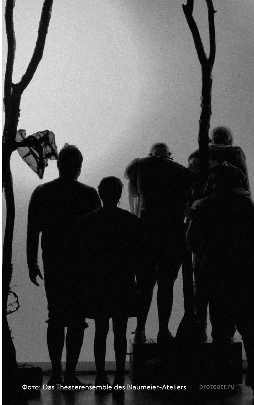
Фото: Das Theaterensemble des Blaumeier-Ateliers